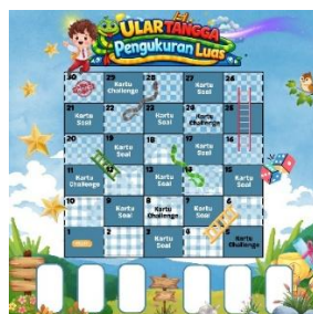
Gambar 2. Desain Media Ular Tangga Pengukuran Luas

revisi produk, uji skala kecil, revisi produk, uji skala besar sampai menghasilkan media ular tangga pengukuran luas. Tampilan desain media ular tangga pengukuran luas tersebut ditunjukkan pada Gambar 2.